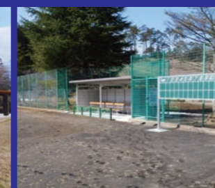
湯元公園野球場 施設改修工事