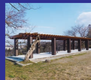
青葉山公園(二の丸跡) 藤棚等改修工事