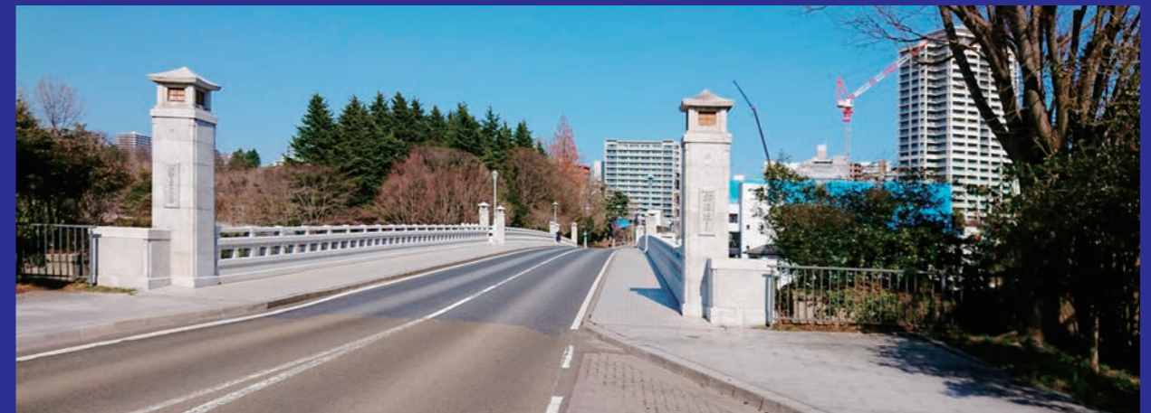
青葉山線大橋橋梁補修工事 (協力工事)

宮城県を中心に多数の実績。これまでに培った経験と技術でお客様の課題を解決いたします。