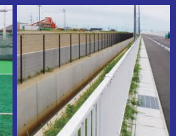
福室排水区(蒲生字屋敷地区) 雨水枝線防護柵設置工事