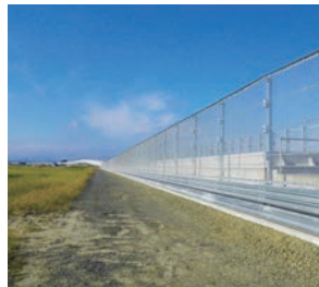
仙台空港アクセス鉄道フェンス工事 (協力工事)