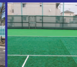
仙台第一高等学校 テニスコート人工芝改修工事